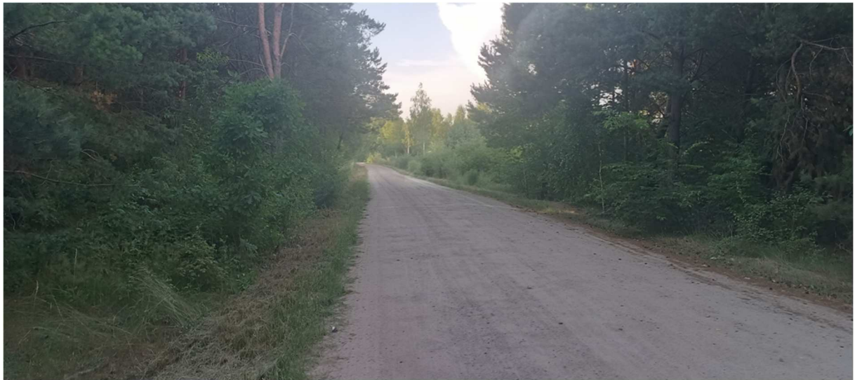
Fot. 3 Widok na drogę gminną