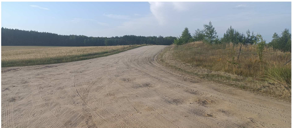
Fot. 4 Widok na drogę gminną