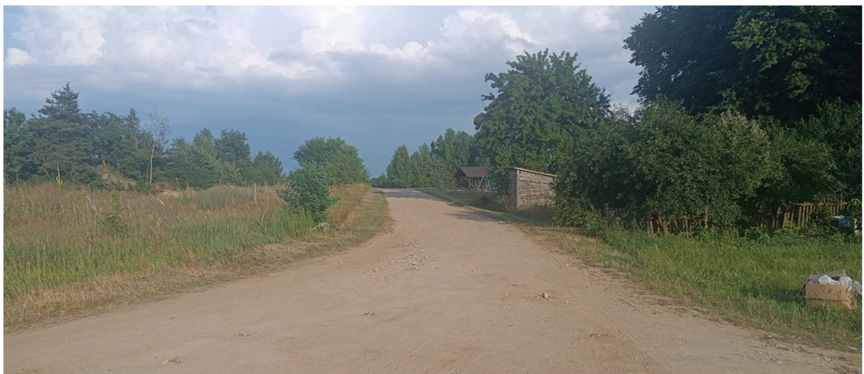
Fot. 5 Widok na drogę gminną