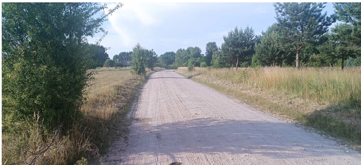
Fot. 1 Widok na drogę gminną